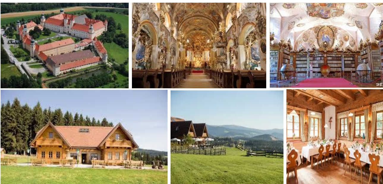
1900 serviertes 4-Gang-Abend-Menü

Nicht gerade leicht aber doch angenehm fahren wir durch die Bucklige Welt bis zum Augustiner-Chorherrenstift Voralpe. Eine Führung ist organisiert und sehr zu empfehlen. Schon bald erreichen wir dann die Bratlmalm, unseren Mittagshalt. Nicht wirklich überraschend fahren wir dann noch viele Kurven, bergauf und bergab, bis wir uns zum letzten Mal auf der Terrasse des Marienhof für unsere Leistung belohnen dürfen.